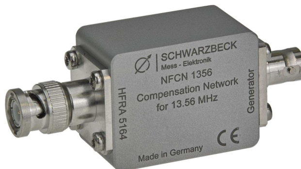
Abb. 1. Kompensationsnetzwerk NFCN 1356. Fig. 1. The NFCN 1356 compensation network.