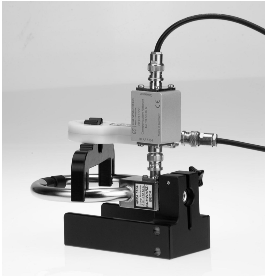
Abb. 3. Aufbau zur Einstellung einer gewünschten H-Feldstärke: das NFCN 1356 ist mit der HFRA 5164 direkt verbunden. Der Loopholder 5164-39 hält die Monitorsspule FESP 5134-1 in 50 mm Abstand zur felderzeugenden Spule HFRA 5164.

Fig. 3. Setup for setting a certain magnetic field strength: The NFCN 1356 is connected directly to the HFRA 5164. The FESP 5134-1 monitoring loop is installed at the distance of 50 mm from the HFRA 5164 using the Loopholder 5164-39.