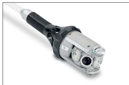
▲ Ibak ORION con asta di spinta e guida autocentrante