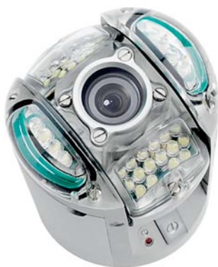
▶ Telecamera a testa rotante ORION con trasmettitore integrato e illuminazione LED