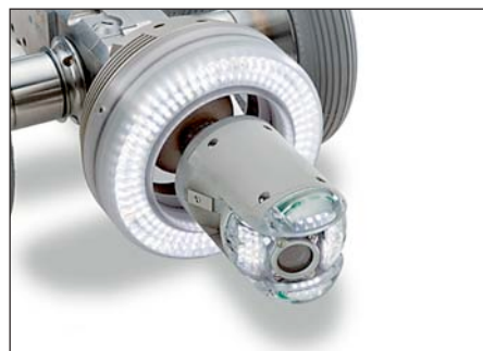
▲ Ibak ORION con trasmettitore integrato, su carro KRA 65 e illuminazione ausiliaria ZSW 65